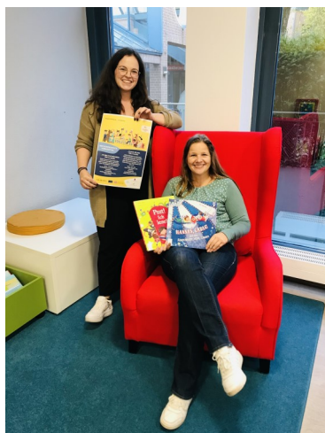
Das Organisationsteam des Vorlesetages

Anmeldung: s.schmehl@duelmen.de , 02594/12446 (vormittags)