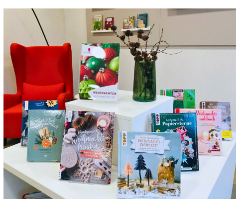
Weihnachtsausstellung im Obergeschoss

Damit bereits die ersten Adventskalender und –kränze gebastelt und die ersten Plätzchen ausprobiert und vernascht werden können, finden Sie ab sofort auf all unseren Ausstellungsflächen unsere Weihnachtsmedien. Neben Büchern zum Basteln und Kochen, finden Sie im Obergeschoss auch die schönsten Weihnachtsfilme und Romane. In der Kinderbücherei warten zauberhafte Geschichten zum Vor- und Selberlesen auf die Kleinen.